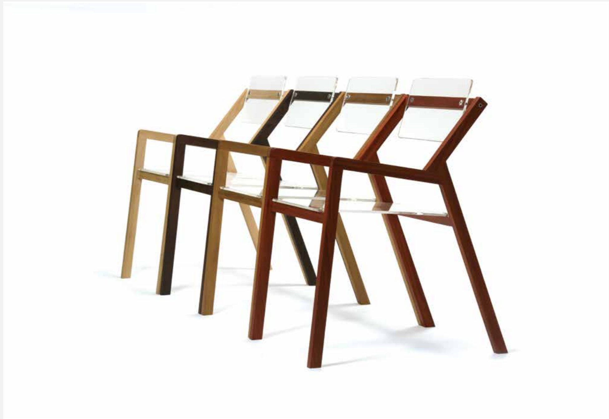
BLOCCO 55 sedia in rovere con seduta e schienale basculante in plexiglass sed_02 . maggio 2012