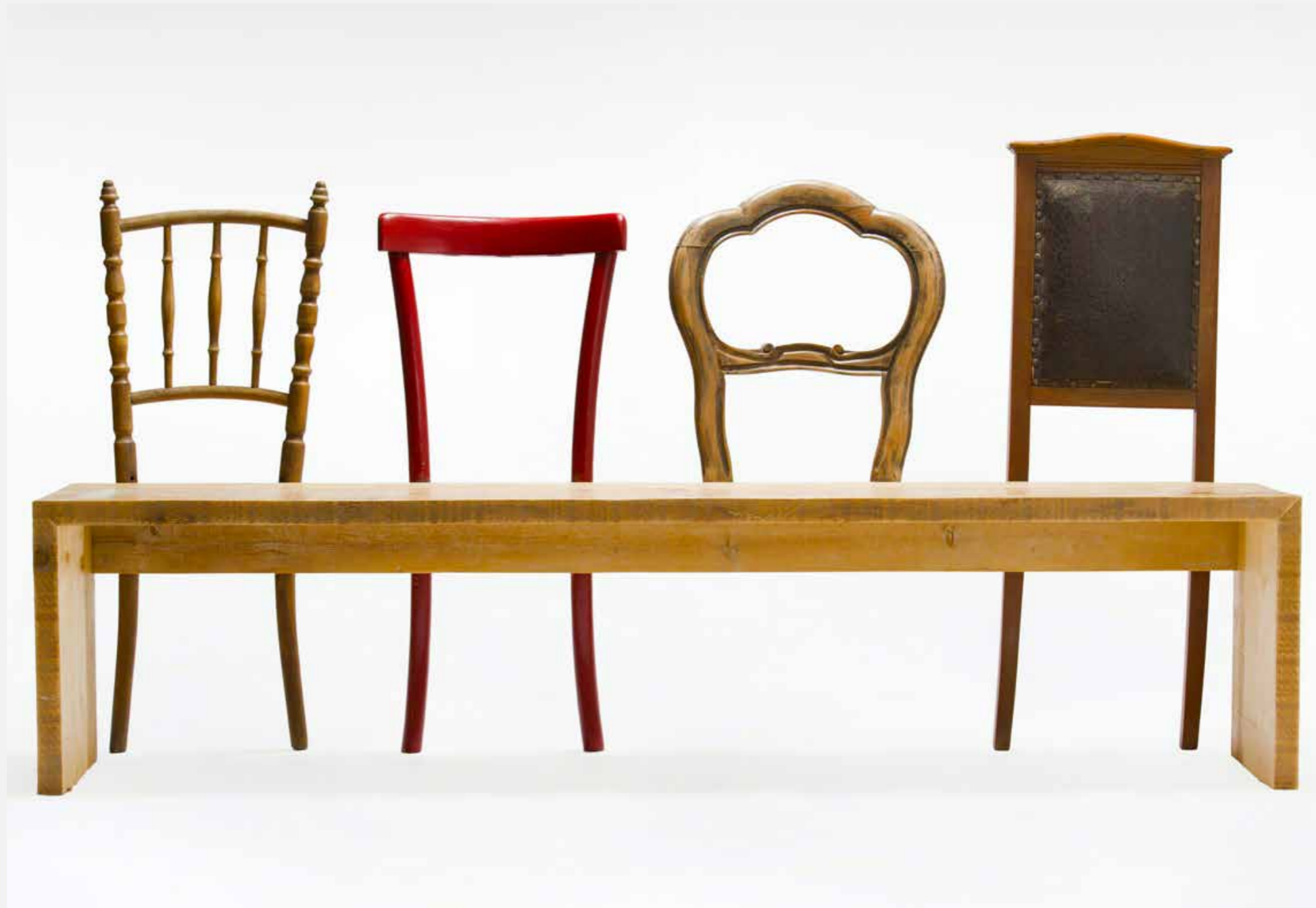
PANCA Panca in abete di recupero con schienali di vecchie sedie sed_01 . Settembre 2013