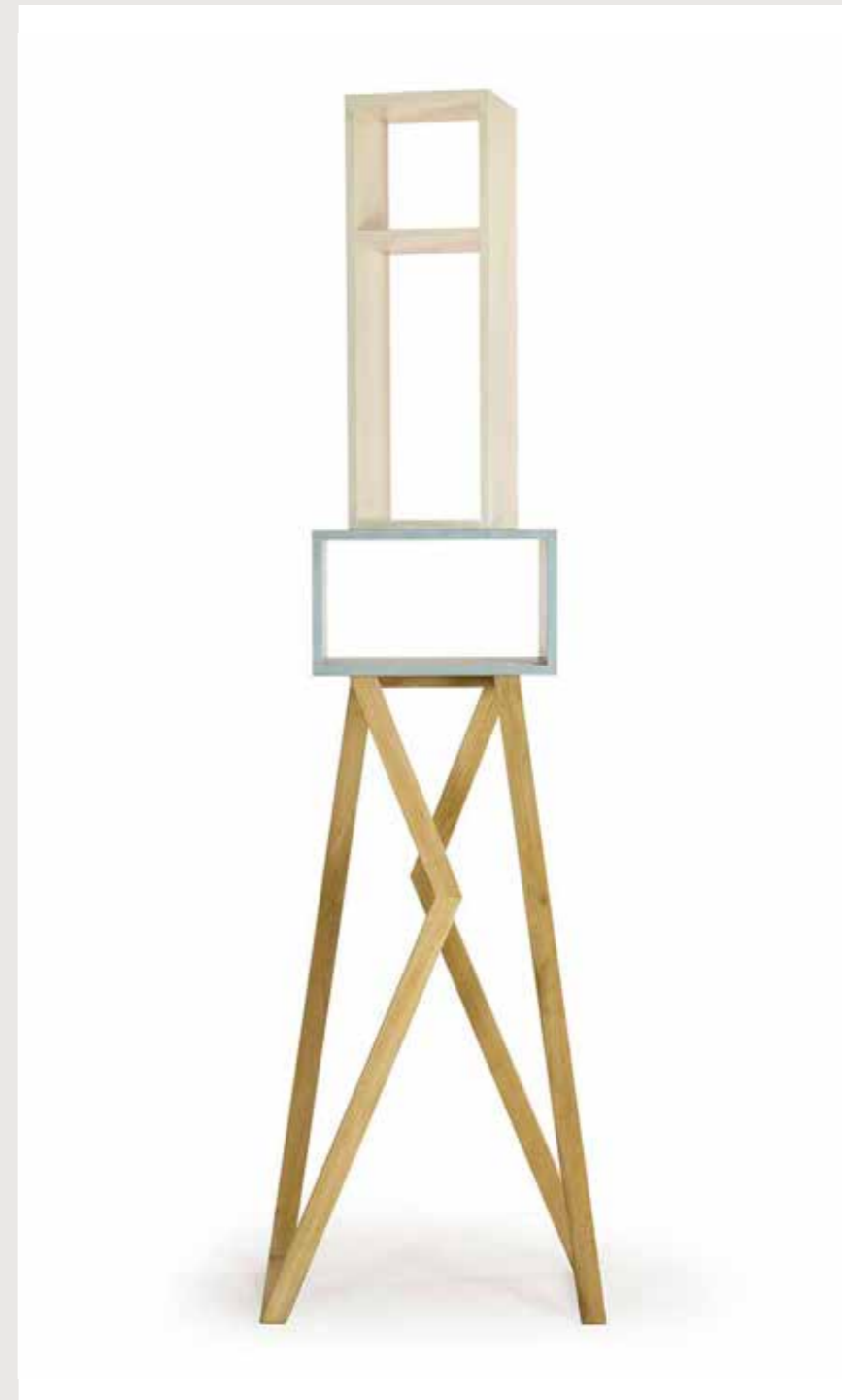
AVATAR moduli scultura in legno di acero e finitura in resina Anno 2016